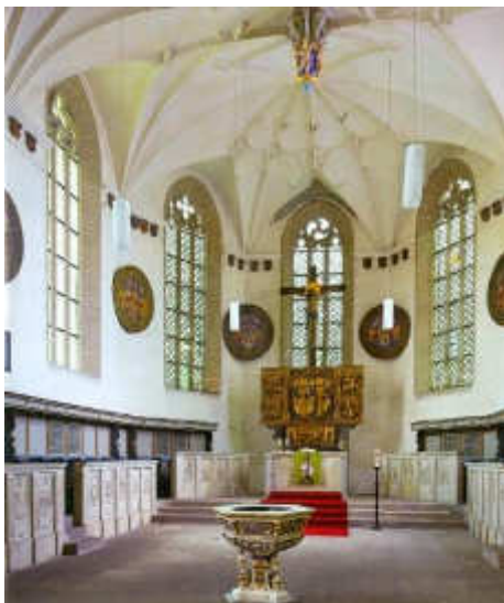
St. Annen Kirche