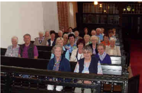
Momente der Besinnung in der Kirche Engerhufe am Ende der Fahrt

Besondere Höhepunkte im Jahreslauf sind die Halbtagsfahrt, der Grillnachmittag und die stimmungsvolle Adventsfeier.